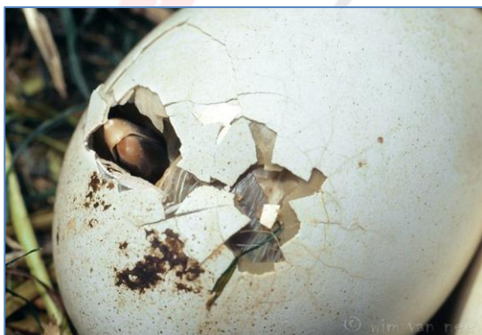
Uitbrekende jonge ooievaar (broedgeval in gevangenschap)

De eieren staan op springen op het moment dat ik dit schrijf. En wanneer u dit leest, is het eerste jong waarschijnlijk al uit zijn of haar ei gekropen. Dan is pa ooievaar eindelijk papa en ma ooievaar mama. (Update zondag 14.35 uur: twee jongen uit)