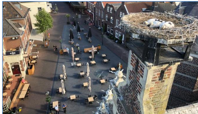
Links de paal die ingeteerd werd, rechts de paal die ingerot is en vervangen moest worden

In Gennepe zit het nest op een prima constructie die goed bevestigd is op de schoorsteen van het oude stadhuis. Vroeger zat het nest op de linker schoorsteen, later is de constructie op de rechter schoorsteen gemaakt en zijn de ooievaars dus een paar meter verhuisd.