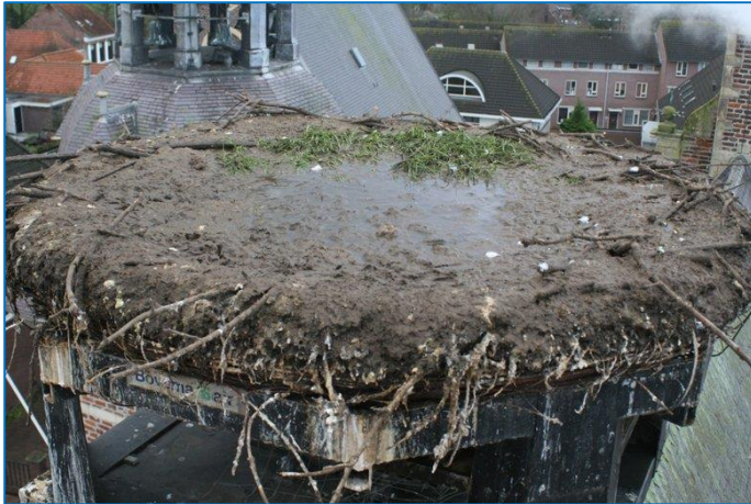
Foto Leo: Zo ziet het nest er vaak uit na het broedseizoen, het laat geen of amper water meer door en dat willen we niet en kan ook niet, dus aan de schoonmaak.

Wim had het in het vorige blog al over het paasmandje met zachte vulling. En over te zwaar worden of omkieperen, dus maken wij dit nest elk jaar schoon.