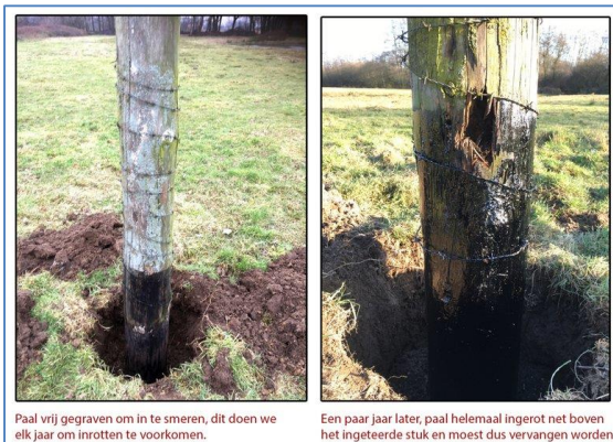
Paal vrij gegraven om in te smeren, dit doen we elk jaar om inrotten te voorkomen.