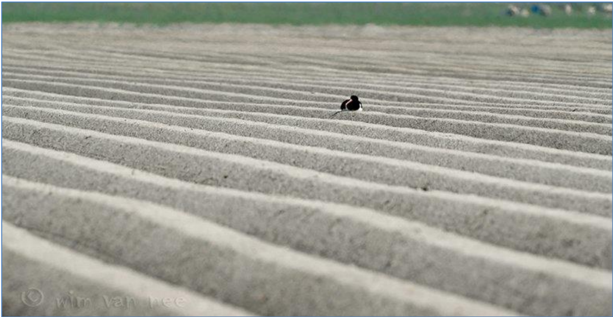
Broedende scholekster op kale akker, kansloze onderneming.