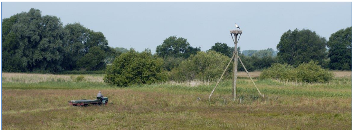
In de uiterwaarden van de IJssel