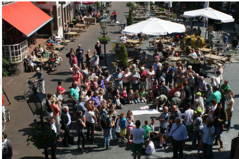
Gennep, ooievaars ringen 2015