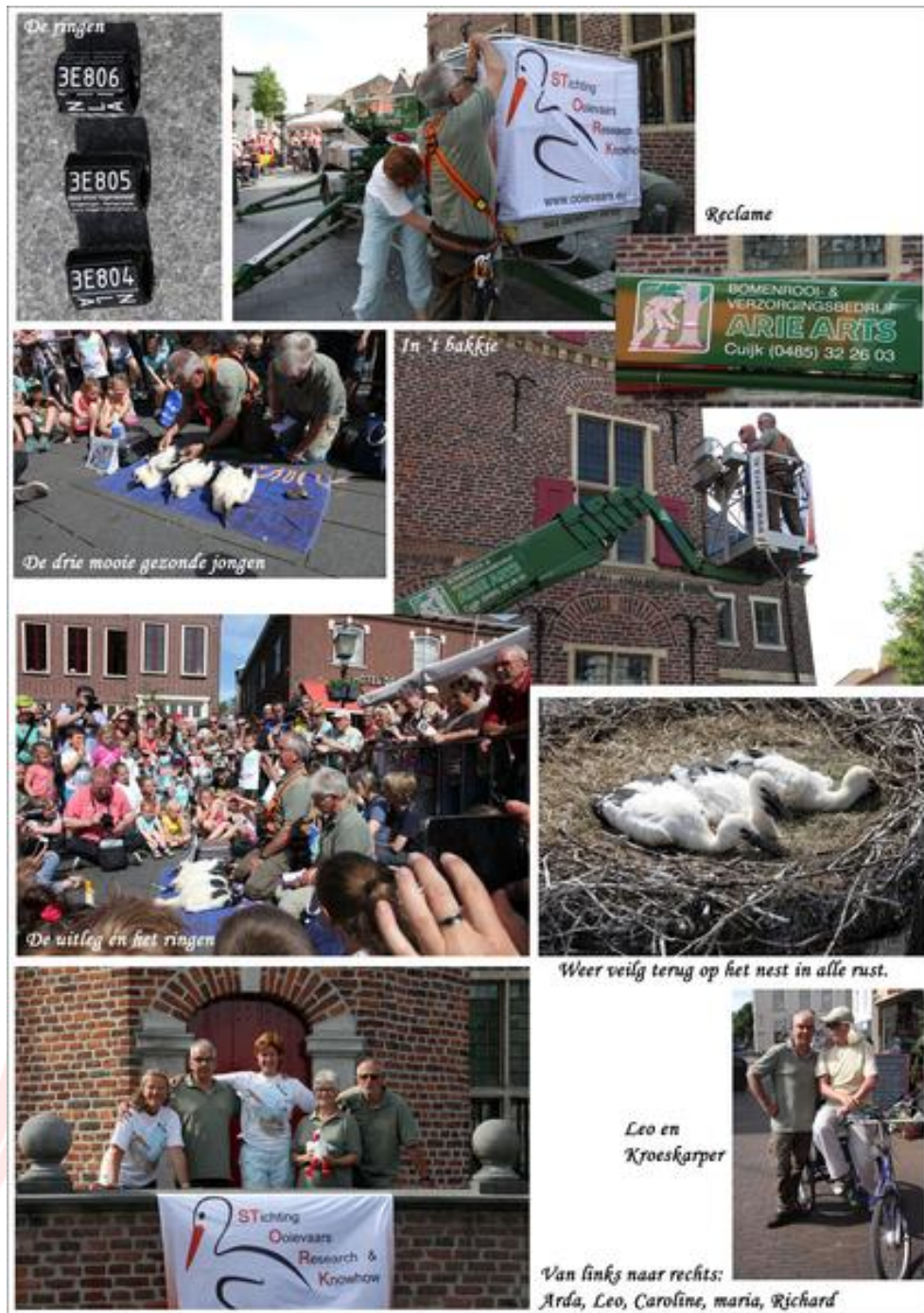
Foto: Leo en Kroeskarper, met dank aan Mihari. Diverse andere foto's met dank aan Caroline en Arda.