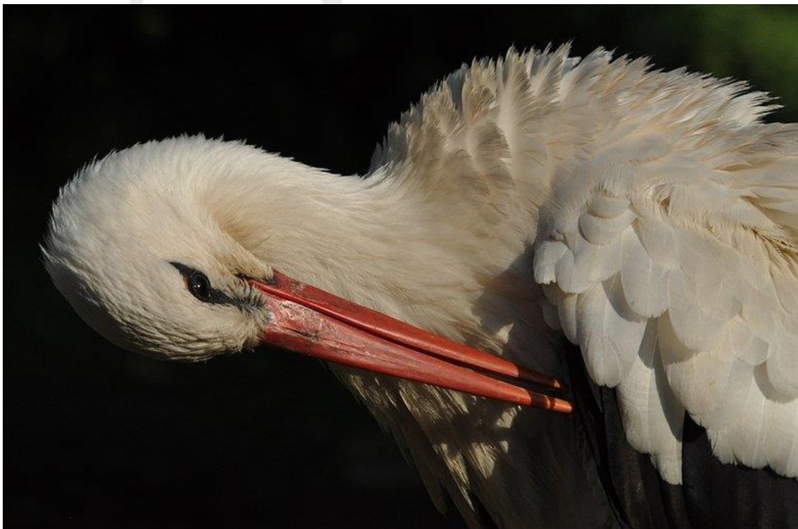
Veren verzorgen (Caroline Walta)

*) een enkele ooievaar heeft soms wat zwart in de staart, kijk maar eens naar de clips waarin je de achterkant van pa (met de ring) ziet.