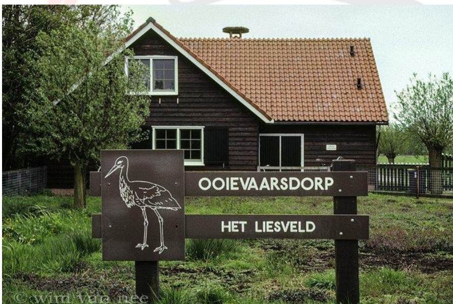
Entreegebouw van Ooievaarsdorp Het Liesveld begin jaren 90

50 jaar ooievaarsproject en Het Liesveld, 40 jaar ooievaarsstation Herwijnen, 10 jaar STORK, samen 100 jaar ooievaarswerk.