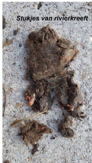
Stukjes van rivierkreeft

Het voedsel van ooievaars wisselt met het beschikbare aanbod. Dieren waarvan er op een bepaald moment in een gebied veel aanwezig zijn, vormen het stapelvoedsel. Leuk om daarom eens de braakballen beter te bekijken.