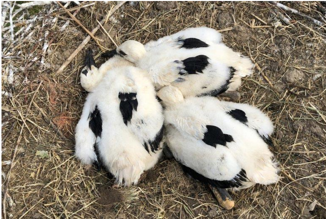
Kuikens houden zich voor dood (Akinese genaamd) als er gevaar dreigt, zo ook als ik boven het nest uitkom. Ja wat zou jij dan doen

Ja en dan zie je regelmatig in het clubhuis de reacties als :