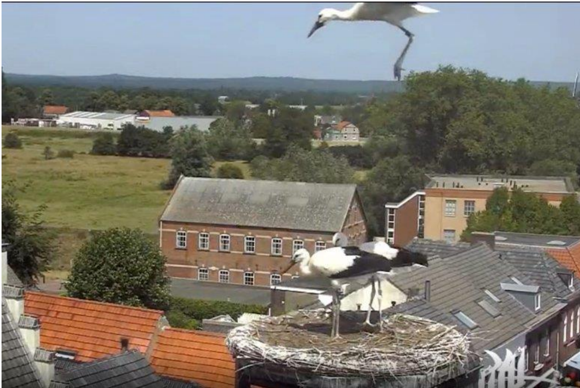
Ja, dit was toch een geweldige mooie afsprong en de eerste hoogste vlieghoogte van dit jaar.