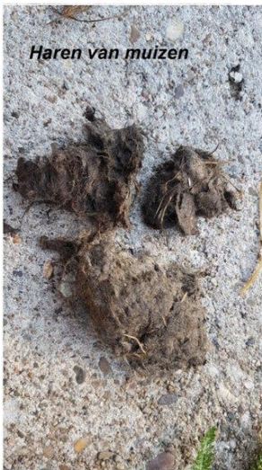
Haren van muizen