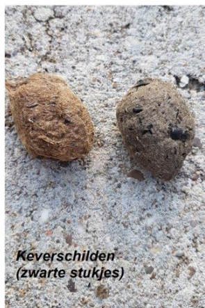
Keverschilden (zwarte stukjes)