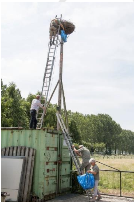
Met de ladder de container op en dan de lange ladder naar het nest op, wel gezekerd met gordel natuurlijk hé !

Ooievaars ringen in Haren en daar waren best veel mensen, maar ook heerlijke koffie en beschuit met muisjes, Mmmmm zo lekker hé.