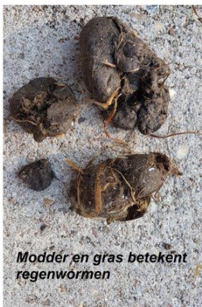
Modder en gras betekent regenwormen