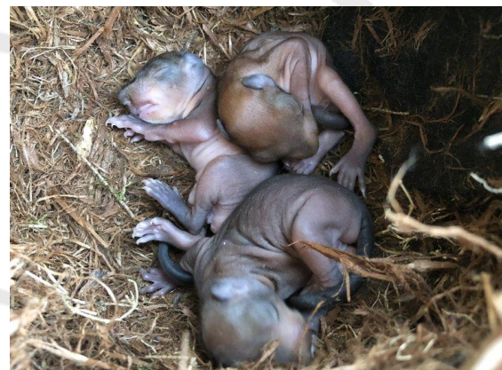
Nest met jonge eekhoorns die de Steenuilenkast ingenomen hadden

Ik, maar ook enkele anderen, hebben het in het clubhuis wel eens over steenuilen, kerkuilen, torenvalken enz. Dus wil ik jullie even meenemen naar een andere wereld, dan die van onze ooievaars.