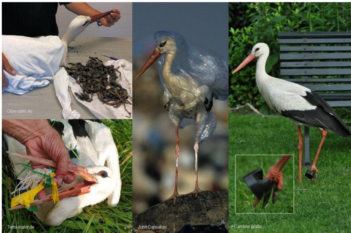
Collage van troep (diverse fotografen)

De ooievaar uit de bovenstaande banner geef alvast het goede voorbeeld van recyclen!