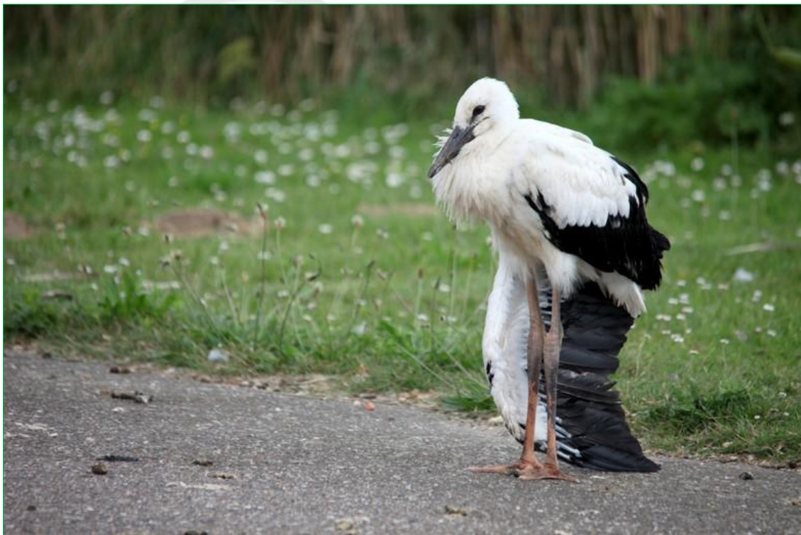
Ooievaar die om welke reden ook, uit het nest gevallen is en deze hebben we in moeten laten slapen.

Hopelijk gaat het deze twee in Gennep beter af en kunnen ze over een poosje, wat Caroline ook al zei, richting Afrika.