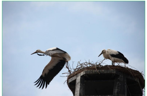
De eerste vluchten van 3E809, de ander was (zover wij weten) toen nog niet van het nest geweest.

Bij veelgestelde vragen komen diverse vragen naar voren, maar ook in het clubhuis worden vaak vragen gesteld. Een veelvoorkomende vraag is: Valt er wel eens een jong per ongeluk uit het nest? Maar ook in het clubhuis gaat het van, Ohh als hij met die wind maar niet overboord gaat. Of jeetje, die staat maar net op het randje, kijk uit joh !!